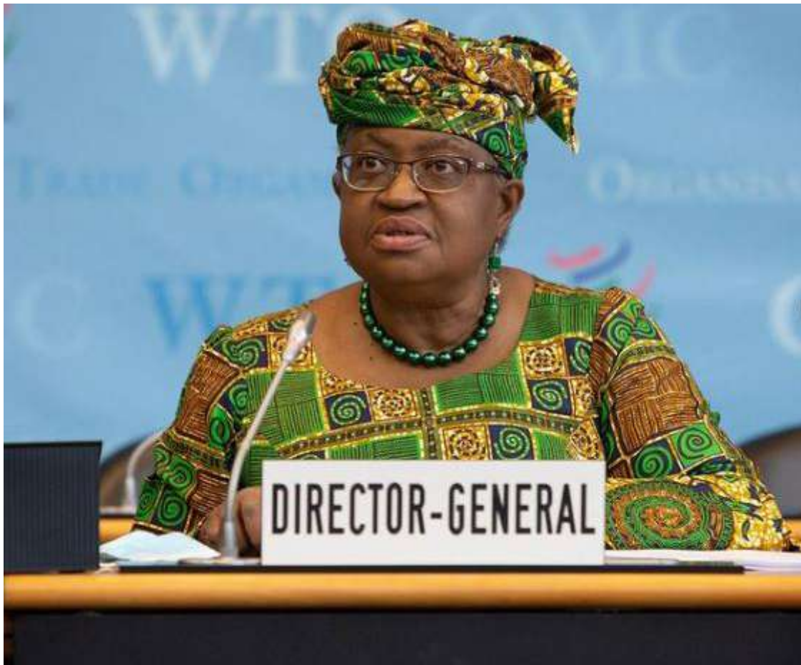
Dr Ngozi OKONJO-IWEALA lors de sa prise de poste à l'OMC

D'origine Nigériane elle entre dans l'histoire en étant la première femme à occuper ce poste, elle remplace son prédécesseur Roberto Azevedo, qui a quitté ses fonctions en août un an avant la fin de son mandat. Cette prise de poste historique démontre que les femmes sont aussi capables que les hommes.